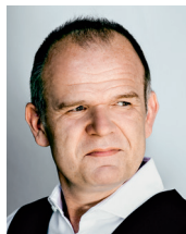
François-Xavier Roth, Gürzenich-Kapellmeister und Generalmusik- direktor der Stadt Köln